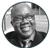
Sezard Chauffeur Compagnon

« CityZen Mobility m'a donné l'occasion de participer à des stages et formations pour pouvoir accompagner des clients de différentes pathologies. Cela est très formateur car aussi lié à notre métier. »